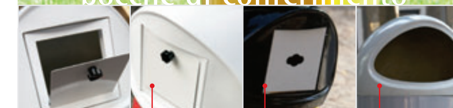
bocca di conferimento per farmaci