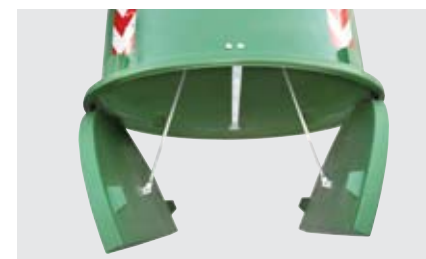
fondo piano a due ante